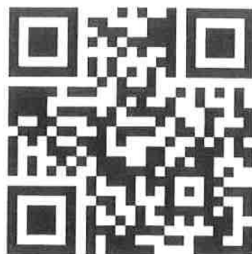
ログイン QR コード