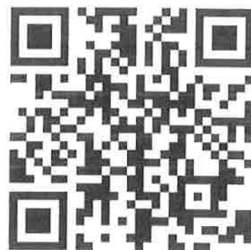
新規登録 QR コード

ログイン後、登録したお写真が画面右上に表示されます。クリックするとデジタル会員証が開きます。編集もそこから可能となります。